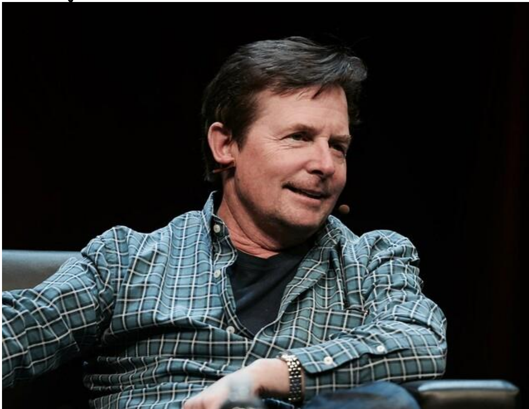
Amerikaanse filmster Michael J. Fox en in eigen land Prins Claus zijn 'bekende' gezichten van Parkinson.